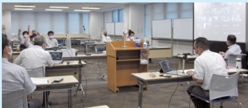
メイン会場の様子 (Web 参加の皆様とオンライン接続)