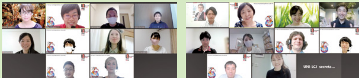
英語セミナーの様子

また、コロナ禍における組合員とのコミュニケーションについて参加者に対して質問があり、対面が難しい中、オンライン会議ツールを活用しての試行錯誤、苦労や工夫の好事例が共有される場面もあり、4時間英語漬けというハードなセミナーが終了しました。