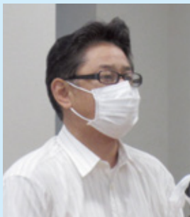
閉会挨拶 勝又副中央執行委員長