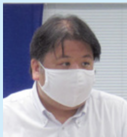
大窄労働条件委員長