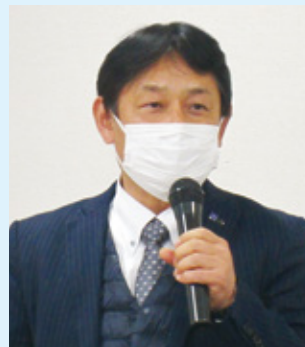
研修会司会 勝又副中央執行委員長