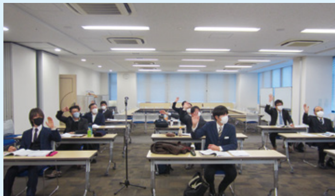
友愛会館 大ホール 会場