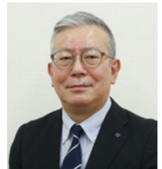
穴戸中央執行委員長